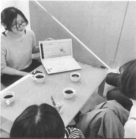
ミニ講座での一コマ