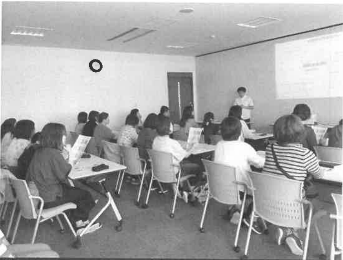
発達支援サポート講座の一コマ