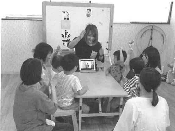
就学前ではICTの教材で遊びます